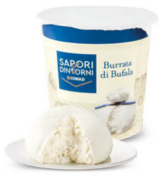
BURRATA DI BUFALA SAPORI&DINTORNI CONAD 125 g