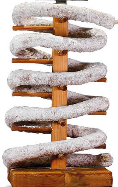
SALAME RAMPICHELO SCHETTINO al taglio all'etto