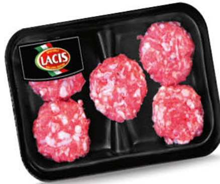
MINIBURGER MAIALE NERO CAMPANO LACIS 240 g