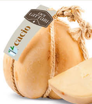
FORMAGGIO CACIO DEI LATTARI al taglio all'etto