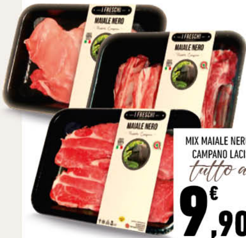
MIX MAIALE NERO CAMPANO LACIS tutto a