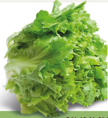
INSALATA SCAROLA CHIUSA origine Campania 1ª categoria