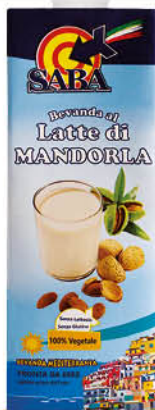
BEVANDA LATTE DI MANDORLA SABA brik - 1 L