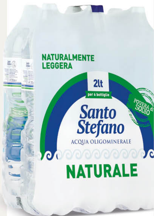
ACQUA NATURALE SANTO STEFANO pet - 6x2 L