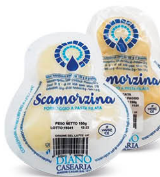
SCAMORZINA DIANO CASEARIA bianca/affumicata 150 g