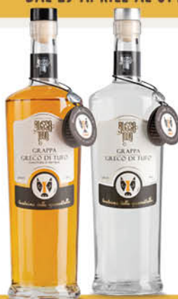
GRAPPA GRECO DI TUFO RUSSO barrique/bianca 50 cl