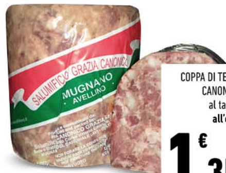
COPPA DI TESTA CANONICO al taglio all'etto