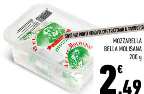
MOZZARELLA BELLA MOLISANA 200 g