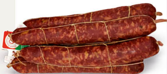
SALAME NAPOLI CANONICO al taglio all'etto