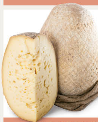
FORMAGGIO GROTTONE bianco/affumicato al taglio all'etto