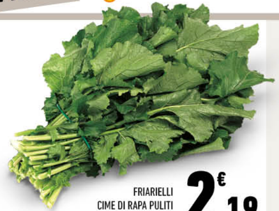
FRIARIELLI CIME DI RAPA PULITI origine Campania - 1ª categoria