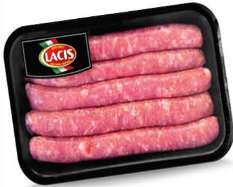
SALSICCIA LUGANEGA MAIALE NERO CAMPANO LACIS