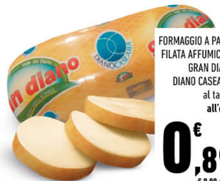
FORMAGGIO A PASTA FILATA AFFUMICATO GRAN DIANO DIANO CASEARIA al taglio all'etto