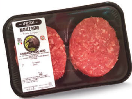
HAMBURGER MAIALE NERO CAMPANO LACIS 220 g