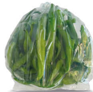
PEPERONCINI FRIGGIARELLI PICCOLI origine Campania 1ª categoria 300 g