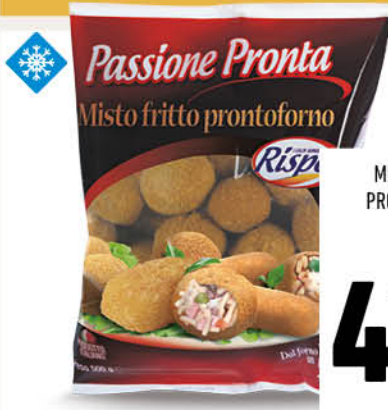
MISTO FRITTO PRONTOFORNO RISPO 500 g