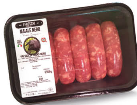
SALSICCE MAIALE NERO CAMPANO LACIS