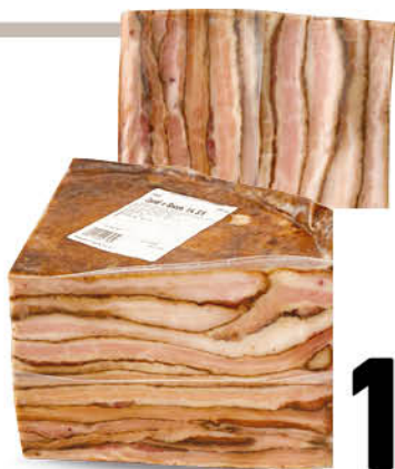
CICCIOLI NAPOLETANI CANONICO all'etto