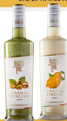
CREMA LIQUORE DISTILLATORI RUSSO 1899 vari tipi - 50 cl