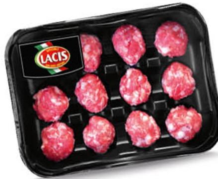
POLPETTINE MAIALE NERO CAMPANO LACIS 240 g