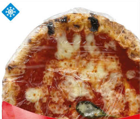
PIZZA MARGHERITA SALVATORE VESI 400 g