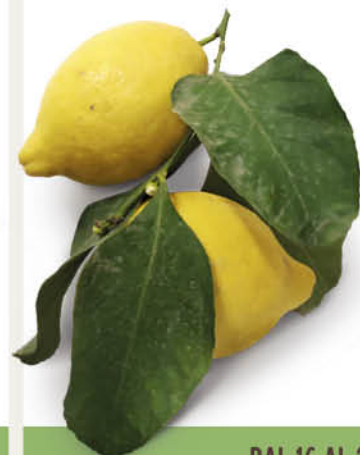
SAPORI DINTORNI CONAD LIMONI COSTA D'AMALFI I.G.P. SAPORI & DINTORNI PERCORSO QUALITÀ CONAD origine Campania 1ª categoria