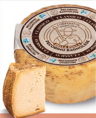
PECORINO CLASSICO STAGIONATO BAGNOLESE al taglio all'etto