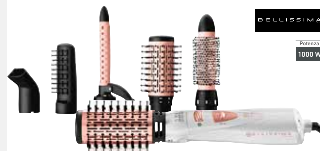
MODELLATORE AD ARIA CALDA 5 IN 1 GH18 BELLISSIMA

rivestimento in ceramica, 2 combinazioni di flusso d'aria/temperatura, posizione aria fredda Cool Fix, cavo girevole da 1,8 m, ideale per tutti gli stili durante l'asciugatura; accessori: concentratore, spazzola tonda 32 mm, spazzola tonda 50 mm, spazzola rettangolare piatta e arricciacapelli 19 mm