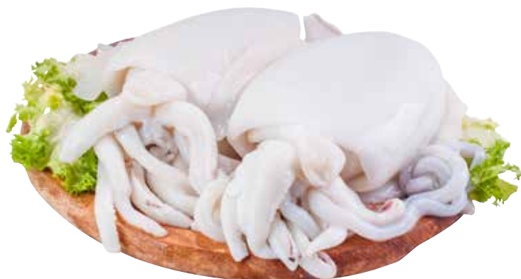
SEPPIA pescato estero