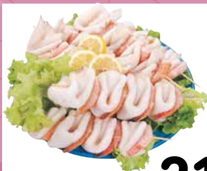
SPIEDINO DI PESCE decongelato