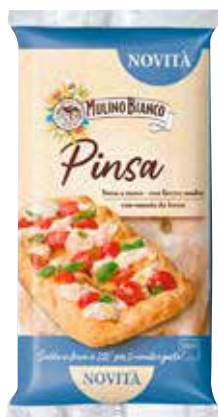
PINSA MULINO BIANCO 230 g