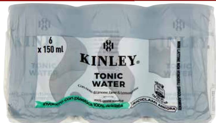
KINLEY TONIC WATER lattina, 15 cl x 6