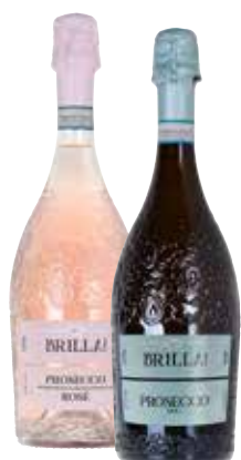
SPUMANTE PROSECCO DOC BRILLA! brut, rosè, 75 cl