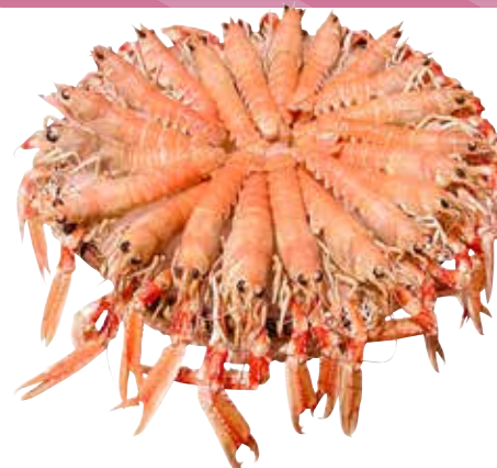
SCAMPO 31/40 pezzi per kg pescato estero decongelato