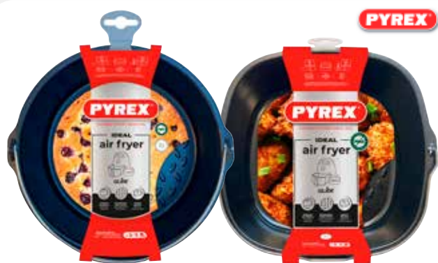
TEGLIA PER FRIGGITRICE AD ARIA PYREX tonda Ø20 cm o quadrata 22 x 21 cm