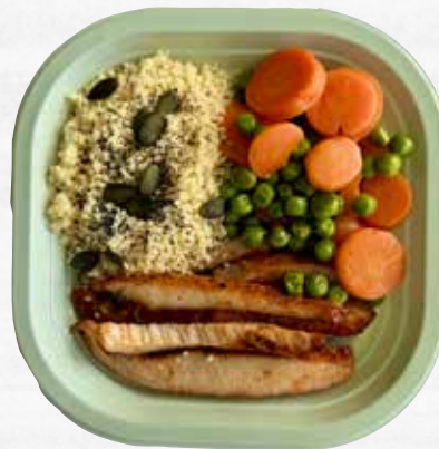
POLLO ALLA PAPRIKA, COUS COUS E PISELLI take away, 250 g