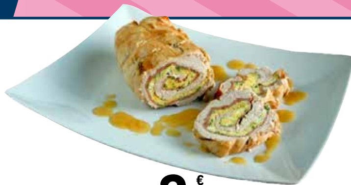
ARROTOLATO DI TACCHINO CON PATATE E SPECK 2,29 €/etto