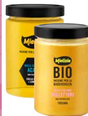
MIELE MIELIZIA acacia, millefiori bio, 700 g