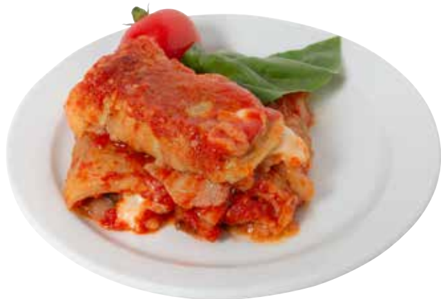
INVOLTINI DI MELANZANE* 0,99 €/etto