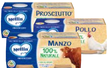
OMOGENEIZZATI ALLA CARNE MELLIN gusti assortiti, 80 g x 2