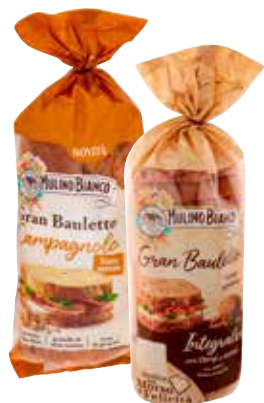
GRAN BAULETTO MULINO BIANCO integrale con semi e noci, campagnolo, 465 g