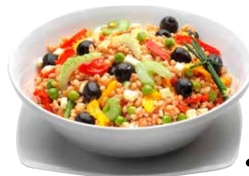
INSALATA DI FARRO 1,29 €/etto