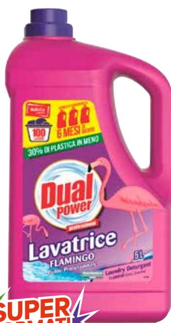
SUPER FORMATI SUPER PREZZI DETERSIVO LAVATRICE DUAL POWER vari tipi, 100 lavaggi 6,99 €