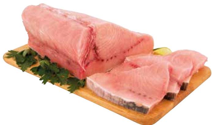
TRANCIO DI FILENE DI PESCE SPADA pescato estero decongelato