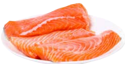
FILETTO DI SALMONE allevato estero