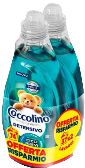
DETERSIVO LAVATRICE COCCOLINO vari tipi, 37 lavaggi x 2 9,90 €