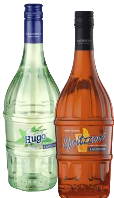
SPRITZZOSO/ HUGO LA GIOIOSA 75 cl