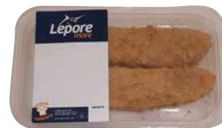
CROCCOFILETTO MSC 170 g