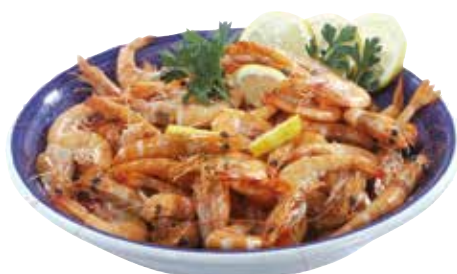
MAZZANCOLLA TROPICALE allevato estero precotta