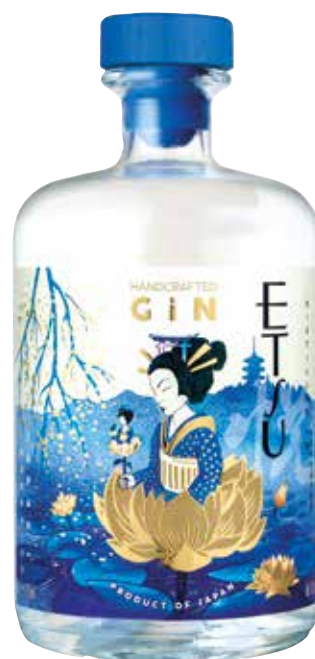
GIN ETSU 70 cl