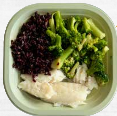
MERLUZZO AL LIME CON BROCCOLI E RISO NERO take away, 250 g

Il tuo benessere quotidiano, GIÀ PRONTO!