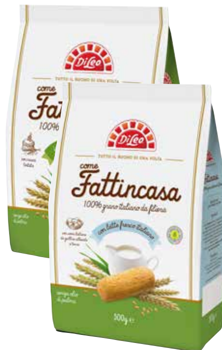
BISCOTTI FATTINCASA DI LEO vari tipi, 430 g, 500 g