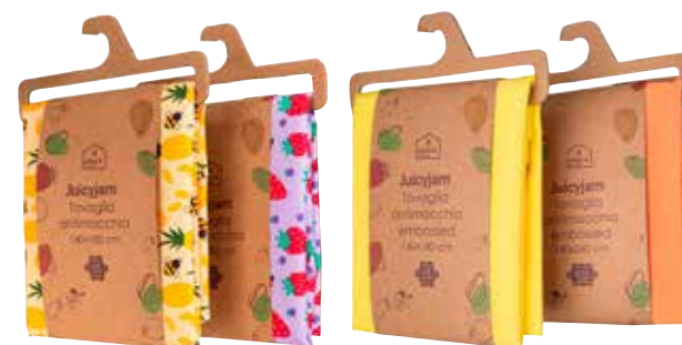
TOVAGLIA ANTIMACCHIA JUICY tinta unita o fantasia, temi e colori assortiti, 140 x 180 cm