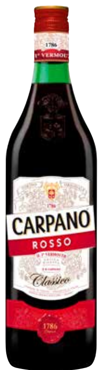
VERMOUTH ROSSO CARPANO 70 cl