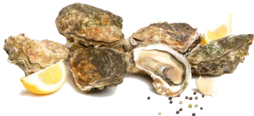
OSTRICHE allevato estero