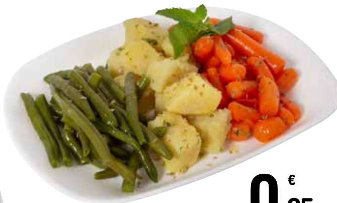
TRIS DI VERDURE 0,95 €/etto