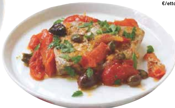
TONNO ALLA GRIGLIA CON OLIVE TAGGIASCHE E PENDOLINI 2,79 €/etto