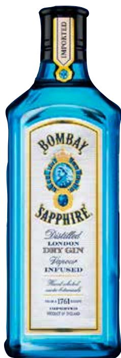
GIN BOMBAY SAPPHIRE 70 cl