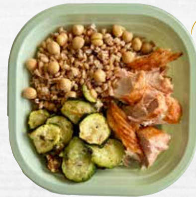
SALMONE AL VAPORE FARRO CECI E ZUCCHINE ALLA MENTA take away, 250 g