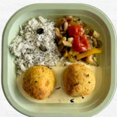
POLPETTE DI CECI CON RISO BASMATI, VERDURE E SALSA YOGURT take away, 250 g