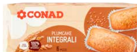
PLUMCAKE INTEGRALE CONAD 198 g