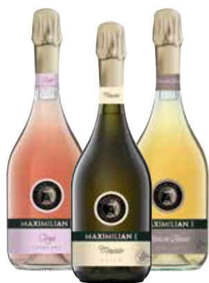
SPUMANTE MAXIMILIAN 1° vari tipi, 75 cl