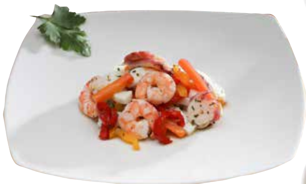
CONAD INSALATA DI MARE CON VERDURE GUSTOSAMENTE CONAD 2,69 €/etto