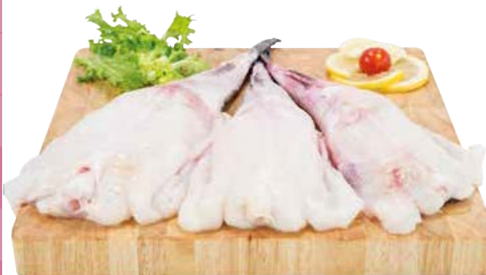
CODE DI RANA PESCATRICE pescato estero