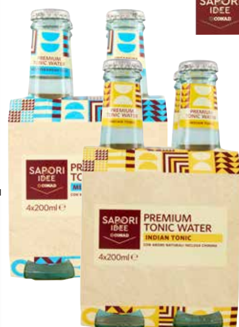
PREMIUM TONIC WATER SAPORI&IDEE CONAD indian tonic, mediterranean taste, 20 cl x 4