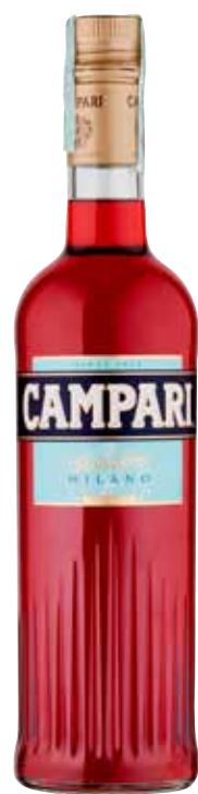
BITTER CAMPARI 70 cl