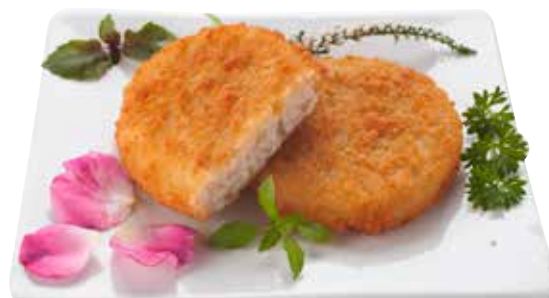
BURGER DI MERLUZZO* 0,99 €/etto

Il tuo benessere quotidiano, GIÀ PRONTO!