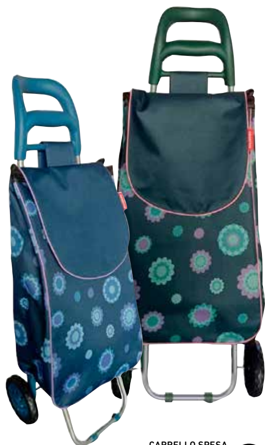
CARRELLO SPESA struttura in metallo, maniglia ergonomica, ruote gommata, sacca in poliestere sfoderabile e lavabile, 35 l, colori assortiti