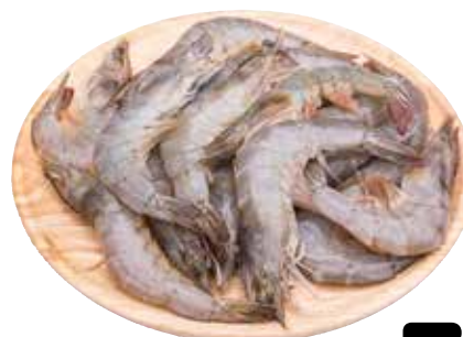
MAZZANCOLLA TROPICALE allevato estero decongelato