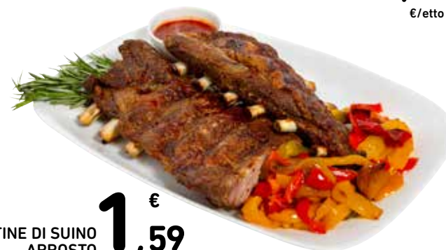
COSTINE DI SUINO ARROSTO 1,59 €/etto