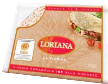
PIADINA LORIANA 350 g