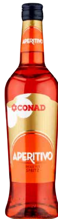
APERITIVO IDEALE PER SPRITZ CONAD 70 cl