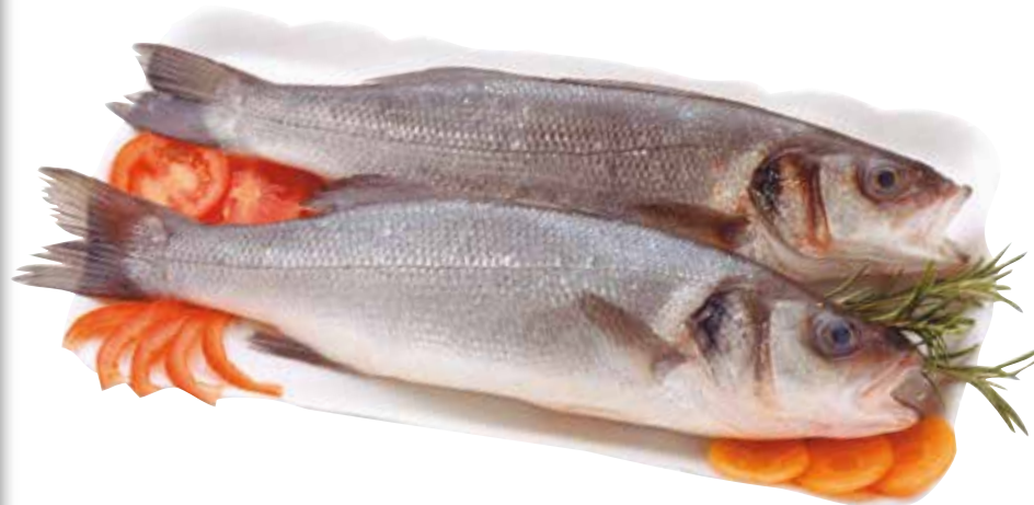
SPIGOLA 400/600 g allevato estero