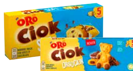
LINEA ORO CIOK orso ciok, oro ciok soft, 150 g