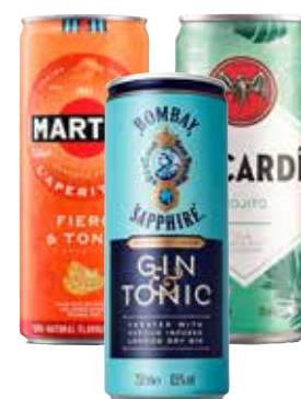
BOMBAY SAPPHIRE GIN&TONIC/ BACARDI MOJITO/MARTINI FIERO&TONIC lattina, 25 cl