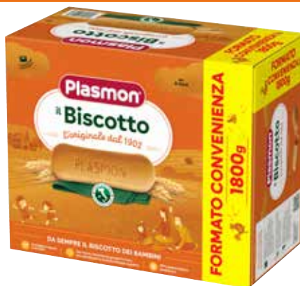
BISCOTTO PLASMON 1800 g