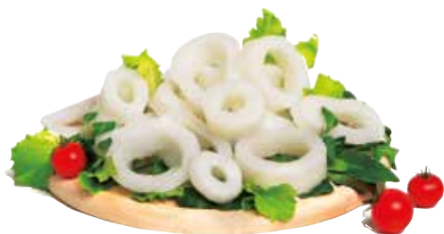
ANELLI DI TOTANO pescato estero decongelato