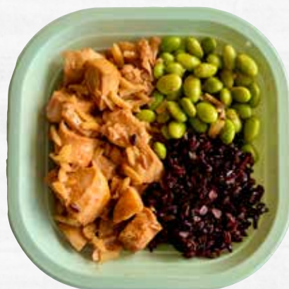
POLLO ALLE MANDORLE CON EDAMAME E RISO NERO take away, 250 g