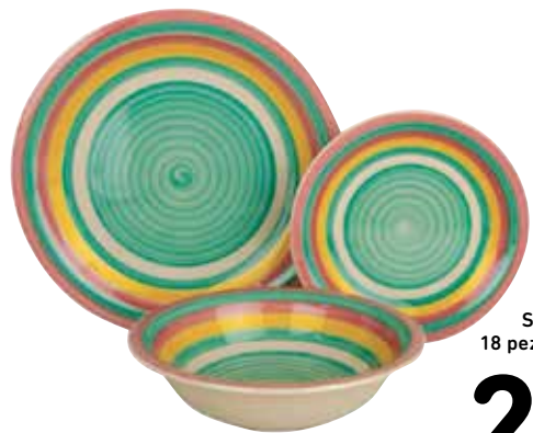
SERVIZIO TAVOLA 18 pezzi, in porcellana