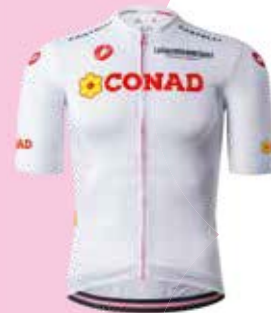
MAGLIA BIANCA GIRO D'ITALIA