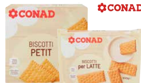
BISCOTTI SECCHI CONAD petit, per latte, 500 g